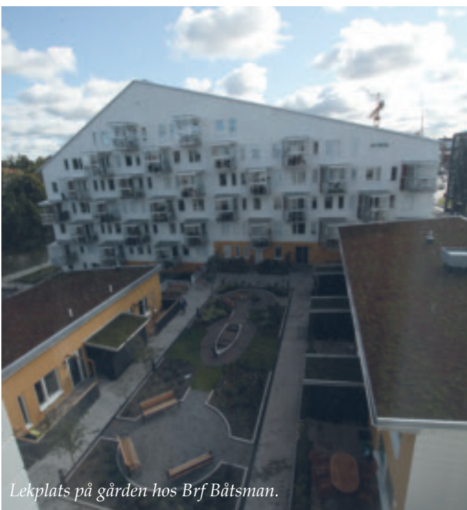
Lekplats på gården hos Brf Båtsman.

Hela Annedal beräknas stå helt klart till 2015 men redan i augusti nästa år planeras för en Bostadsutställning av området.