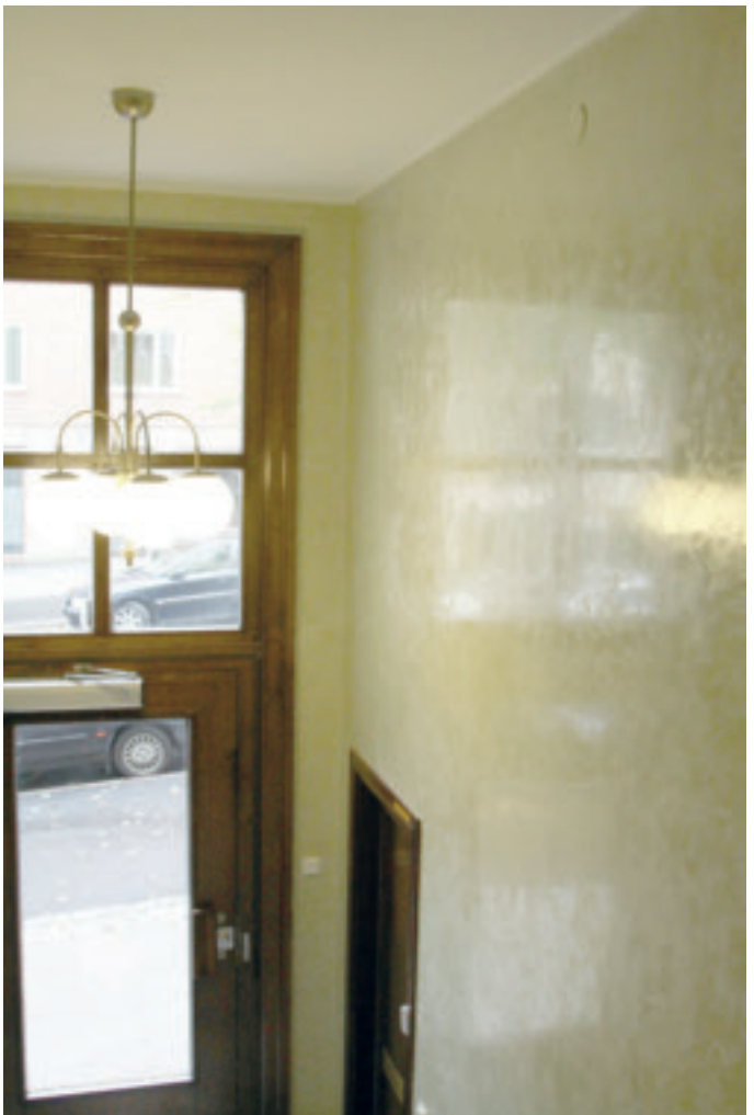
De stålglättade och vaxade Stucco lustroväggarna speglar ljuset från den tidstypiska ljuskronan i entrén.