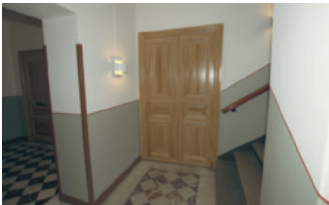
Det är en fläkt av 1800-tal över färgsättningen av trapporna, som har blivit mycket uppskattat av de boende i huset