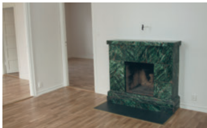
En färdig lägenhet klar för tillbakafllyttning för hyresgästen

Arbetet påbörjades i november 2009 och be- räknas vara slutfört un- der maj/juni 2011.