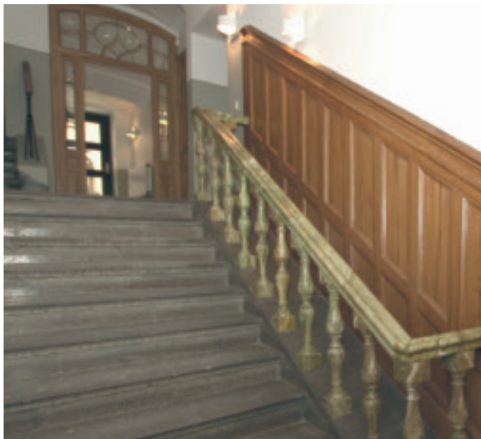
Marmoreringen av entréräcket ger hela trappentrén ett lyft.